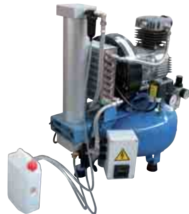
Volt 230/50 1-ph 220/60 1-ph 115/60 1-ph