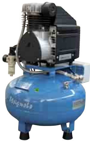
Volt 230/50 1-ph