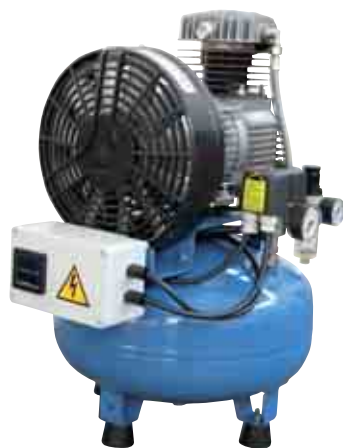
Volt 230/50 1-ph 220/60 1-ph 115/60 1-ph