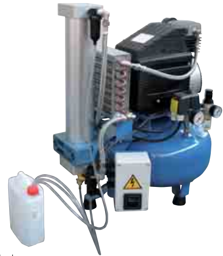
Volt 230/50 1-ph